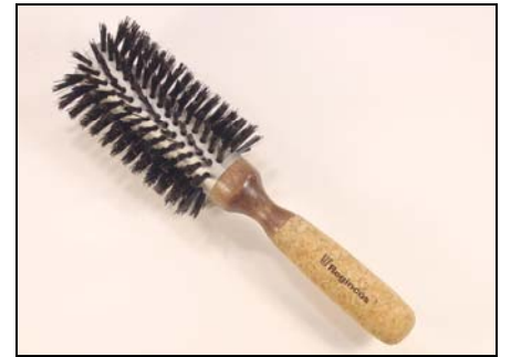
# 20760 – Large (65 mm.dia.)