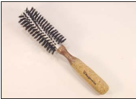
# 20708 – Small (45 mm.dia)

Pure natural bristles (first cut), reinforced with nylon for an easy brushing and without damaging the hair structure.