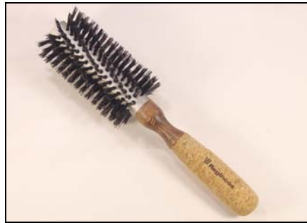
# 20740 – Medium (55 mm.dia.)